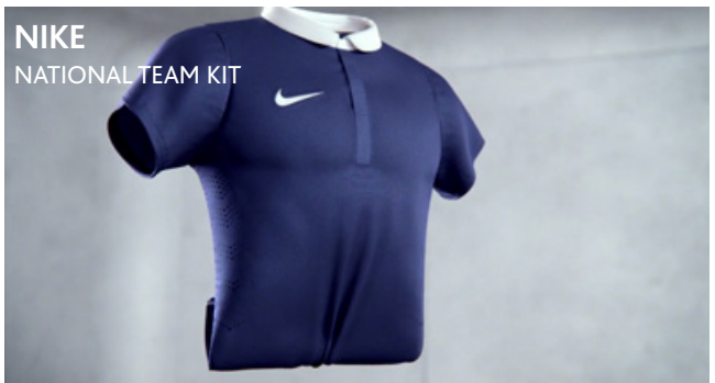
NIKE NATIONAL TEAM KIT