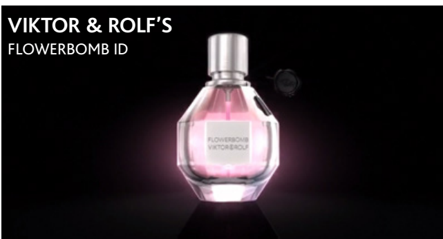
VIKTOR & ROLF'S FLOWERBOMB ID